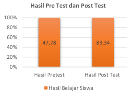
Gambar 1. Pre Test dan Post Test

Berdasarkan hasil pre test sebelum peserta didik menggunakan E-Modul berbasis aplikasi flipbook dapat dilihat bahwasannya peserta didik selama melaksanakan pembelajaran daring dapat dikatakan masih kurang maksimal sehingga mempengaruhi terhadap hasil belajar peserta didik. Pada hasil post test menunjukkan perubahan terhadap hasil belajar, selain mengalami perubahan pada hasil belajar peneliti mendapatkan data dari hasil observasi bahwasannya setelah menggunakan E-Modul berbasis aplikasi flipbook , peserta didik dapat meningkatkan motivasi belajar dan rasa ingin tahu peserta didik meningkat. Di dalam E-modul tersebut berisikan beberapa pertanyaan serta permasalahan yang nantinya dapat dipecahkan oleh peserta didik itu sendiri. Penggunaan E-modul pembelajaran tematik berbasis aplikasi Flipbook dapat meningkatkan hasil belajar dikarenakan peserta didik merasa lebih mudah memahami isi materi hal tersebut didukung adanya ilustrasi gambar dan video pembelajaran serta latihan soal-soal. Hal tersebut sejalan dengan hasil penelitian Setiyo & Harlin (2018) menyatakan penggunaan E-modul dalam pembelajaran tematik berbasis aplikasi flipbook dapat meningkatkan hasil belajar. Hal tersebut didukung oleh hasil penelitian Kuncahyono (2018) bahwa E-Modul menarik perhatian dan motivasi siswa karena siswa menjadi lebih mudah untuk memahami materi. (Dewi & Lestari, 2020) mengatakan bahwa E-modul juga memiliki dampak positif terhadap hasil belajar peserta didik.