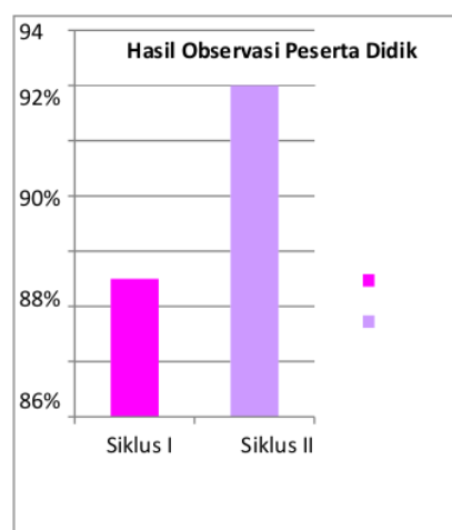
Diagram 1.2 Hasil Presentase Obseravsi Peserta didik

“Penerapan Model Pembelajaran Problem Based Learning Berbantu Media Power Point Untuk Meningkatkan Minat Belajar Siswa Sekolah Dasar”.