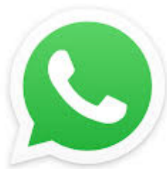
Gambar 2.1 Logo WhatsApp

WhatsApp merupakan sebuah sarana untuk melakukan komunikasi yang berguna untuk saling bertukar pesan yang biasanya berbentuk gambar, viideo, teks, bahkan melali video telepon.(Suryadi, 2018:15). Didalam aplikasi ini terdapat fitur-fitur yang didapat membantu penggunanya untuk berkomunikasi , dalam penggunaan WhatsApp memerlukan bantuan internet. Adapun fitur yang terdapat dalam WhatsApp yaitu contact untuk menyisipkan kontak, audio digunakan untuk digunakan untuk mengirimkan pesan suara, galery untuk menambahkan foto dan lain-lain. Semua fitur yang ada di whatsapp sangat membantu memudahkan interaksi antar individu