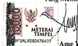
Ame Yasmin Salama