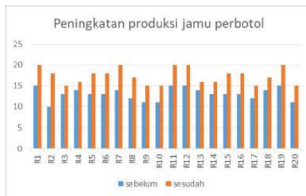
Gambar 15. Peningkatan produksi setelah mendapat bantuan blender

Terjadi peningkatan hasil produksi dan penghematan waktu setelah “bakul Jamu” mendapatkan bantuan blender dan pelatihan, sebagaimana tampak pada diagram.