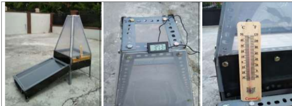
Gambar 9. Alat pengering dengan sinar matahari