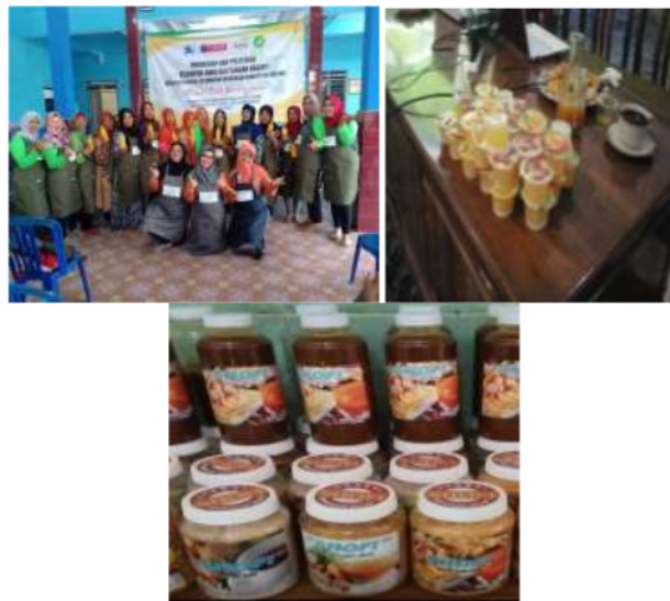
Gambar 6. Pelatihan Pengemasan dan hasil pengoperasian cupsealer