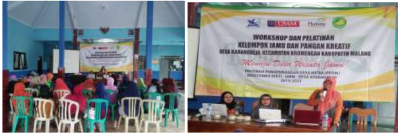
Gambar 7. Pelatihan pemasaran online dan pengoperasian Blogspot