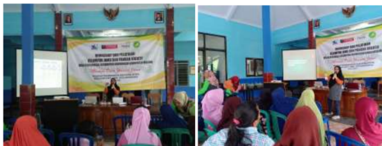
Gambar 4. Penyuluhan bahan kemasan yang aman bagi jamu