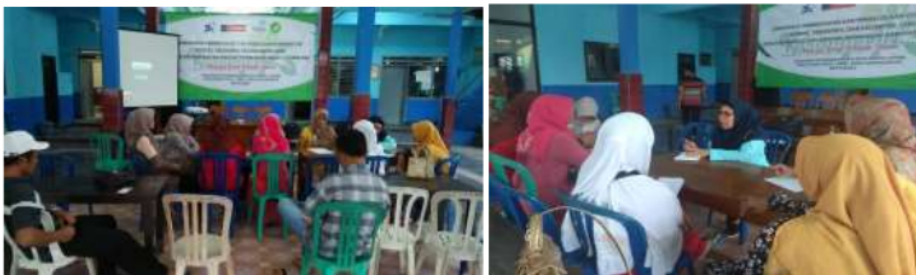
Gambar 10. Proses dialog dan mediasi pembentukan kelompok jamu, serta pemndampingan penyusunan struktur organisasi

Metode ini dilakukan oleh tim pengabdian UMM ketika diketahui permasalahan tentang kelompok jamu yang sebelumnya sudah terbentuk, namun tidak menampung seluruh anggota kelompok jamu serta belum memiliki manajemen organisasi yang benar. Perkumpulan yang ada terbatas hanya untuk arisan dan pengajian. Keberadaan tim pengabdian UMM membantu memfasilitasi diskusi dan dialog dengan pengurus lama hingga akhirnya terbentuk POKJAMU baru yang memiliki pengurus baru, AD/ART baru serta memiliki strategi dalam pengembangan produksi anggota kelompok.