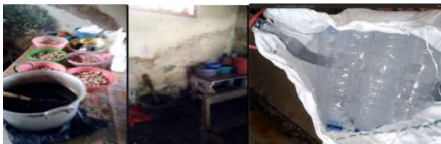
Gambar 2. Proses pengolahan jamu yang masih konvensional dengan kemasan daur ulang

Hasil jamu ini sangat istimewa karena hasil produksinya yang nikmat, lebih tahan lama meskipun tanpa pengawet, namun untuk mendapatkan hasil produk jamu yang memuaskan ini memerlukan waktu, dan tenaga yang banyak. Proses produksi yang masih menggunakan peralatan tradisional, mempertahankan produksi yang menjaga higienitas juga masih memprihatinkan, penggunaan botol-botol bekas yang beresiko terhadap Kesehatan, menyebabkan hasil produksi terbatas omset serta belum layak untuk dipublikasikan lebih luas. Kebiasaan menggunakan gelas bergantian dengan pembeli lain juga masih menjadi fenomena umum. Kemampuan memilih dan mengadakan fasilitas dan peralatan yang layak hygiene masih menjadi focus utama mengapa konsumen hanya terbatas pada masyarakat ekonomi rendah, yang tidak terlalu peduli dengan kebersihan dan Kesehatan.