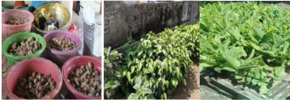
Gambar 1. Sumber bahan alam obat-obatan yang mudah diperoleh di desa Karangrejo

Hasil jamu ini sangat istimewa karena hasil produksinya yang nikmat, lebih tahan lama meskipun tanpa pengawet, namun untuk mendapatkan hasil produk jamu yang memuaskan ini memerlukan waktu, dan tenaga yang banyak. Proses produksi yang masih menggunakan peralatan tradisional, mempertahankan produksi yang menjaga higienitas juga masih memprihatinkan, penggunaan botol-botol bekas yang beresiko terhadap Kesehatan, menyebabkan hasil produksi terbatas omset serta belum layak untuk dipublikasikan lebih luas. Kebiasaan menggunakan gelas bergantian dengan pembeli lain juga masih menjadi fenomena umum. Kemampuan memilih dan mengadakan fasilitas dan peralatan yang layak hygiene masih menjadi focus utama mengapa konsumen hanya terbatas pada masyarakat ekonomi rendah, yang tidak terlalu peduli dengan kebersihan dan Kesehatan.