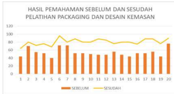
Gambar 12. Diagram pengetahuan sebelum dan sesudah pelatihan packaging dan desain kemasan

pengetahuan setelah edukasi/penyuluhan, hal ini didukung oleh teori yang bahwa metode yang digunakan dalam pendidikan/penyuluhan juga mempengaruhi kemampuan merubah tingkat pengetahuan. Tingkat pengetahuan dapat dirubah dengan kombinasi berbagai macam metode yaitu metode ceramah, presentasi, wisata karya, curahan pendapat, seminar serta diskusi panel. Oleh karena itu, seseorang dapat mempelajari sesuatu apabila menggunakan lebih dari satu panca indera (Purnama, 2013). Pada aspek Packaging, hasil kemampuan yang diperoleh juga mengalami peningkatan, sebagaimana pada diagram dibawah ini