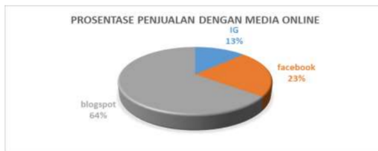
Gambar 13. prosentase penjualan jamu dengan media online

Pelatihan apapun pasti akan memberikan dampak pada perubahan, baik pada pengetahuan, sikap maupun Tindakan/perilaku. Pelatihan pemasaran online yang diberikan kepada pengusaha jamu, juga memberikan strategi baru dalam pemasaran (Susanti, 2020), terbukti bahwa Sebagian kecil “bakul jamu“ yang sudah mempraktekkan pemasaran menggunakan media social online.