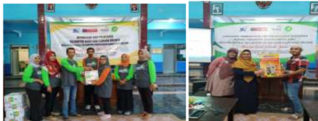
Gambar 8. Penyerahan bantuan alat-alat produksi jamu dan pengemasan pada kelompok jamu berupa Blender dan Cup sealer

Selain pendampingan dengan penyuluhan dan pelatihan, tim Pengabdian UMM juga memberikan bantuan berupa alat-alat untuk pendukung produksi agar lebih hemat waktu, energi dan biaya. Alat tersebut diantaranya, blender, cupsealer dan alat pengering dengan teknologi panas dari sinar matahari.