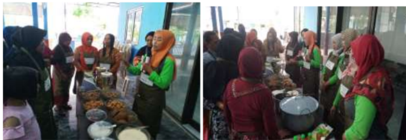
Gambar 5. Proses demonstrasi pada saat pelatihan pembuatan jamu higienis

Selain penyuluhan, kegiatan lain yang dilakukan dalam rangka pendampingan adalah Pelatihan. Pelatihan yang dilakukan diantaranya adalah; pelatihan pembuatan jamu dengan metode higienis, Pelatihan pembuatan jamu instan, Pelatihan pengemasan, packaging yang kekinian, pelatihan pemasaran online baik dengan menggunakan Instagram maupun blog paguyuban yang disertai dengan demonstrasi atau percontohan untuk realisasinya. Pelatihan juga dilakukan pada pengoperasian peralatan, di antaranya penggunaan alat cupsealer, pengoperasian alat pengering rimpang dengan tenaga surya.