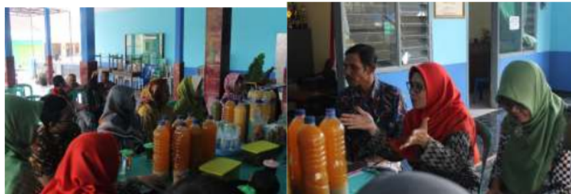
Gambar 3. Sosialisasi awal kegiatan pendampingan kelompok jamu

Kegiatan-kegiatan ini diantaranya adalah penyuluhan dan pelatihan. Kegiatan penyuluhan di antaranya adalah penyuluhan tentang metode pengolahan jamu yang higienis, dimana dalam proses pengolahan digunakan air yang sudah dimasak, sehingga bebas bakteri serta proses pengolahan dengan menggunakan celemek dan sarung tangan plastic agar semua bahan jamu tidak tersebutuh tangan. Proses pengolahan juga di ajarkan untuk menjaga kualitas dimana proses pengolahan tersebut tidak menghilangkan kandungan dari bahan herbal yang berkhasiat meningkatkan daya tahan atau imunitas tubuh. Penyuluhan juga dilakukan dalam rangka mengenal bahan-bahan kemasan yang berbahaya dan yang aman bagi produk jamu yang dihasilkan. Pengenalan terhadap jenis-jenis botol plastik serta kemasan lainnya dilakukan untuk merubah perilaku “bakul jamu” yang cenderung menggunakan botol bekas yang berbahaya bagi Kesehatan. Penyuluhan dan peningkatan pemahaman tentang teknologi pengemasan dan teknologi pembuatan jamu dari rimpang kering, diberikan dengan didukung oleh bantuan alat dengan sentuhan teknologi tenaga surya. Semua kegiatan ini ditujukan untuk meningkatkan pemahaman serta kesadaran masyarakat sekaligus menjadi dasar publikasi dan keunggulan bagi desa yang akan memproklamirkan sebagai desa wisata jamu dan pangan kreatif.