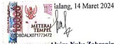
Alvira Nuke Zahroningrum

Demikian pernyataan ini saya buat dengan sebenarnya untuk dipergunakan sebagaimana mestinya.