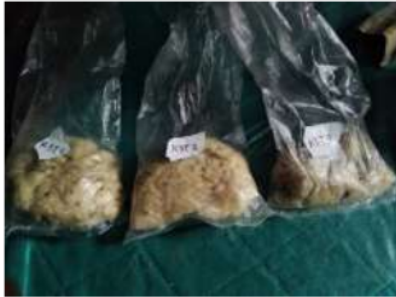
Gambar 2. Getah pinus Kualitas B

Kualitas getah pinus dalam penelitian ini dibagi menjadi 2 yaitu kualitas A (getah mutu I) yang kualitasnya sangat bagus, yaitu getah yang keluar langsung dari koakan pohon mengalir menuju wadah penampung getah dan teksturnya lebih encer. Sedangkan getah kualitas B (getah mutu II) yaitu getah yang diambil berwarna putih kristal dalam artian getah yang sudah beku yang terdapat pada dinding koakan pohon pinus.