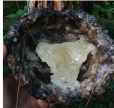
Gambar 1. Getah pinus kualitas A

Spesifikasi getah kualitas A dilihat dari warnanya yang lebih putih bening dan bersih. Pengujian kualitas getah dilakukan dengan uji visual dengan melihat dari warna getah. Pemanenan getah kualitas A dari kombinasi perlakuan K (konsentrasi larutan) dengan kombinasi perlakuan T (waktu penyemprotan larutan) dapat dilihat pada Gambar 1 di bawah ini :