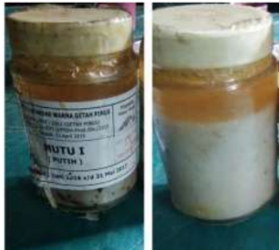
Gambar 3. Standar getah mutu I