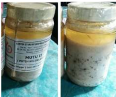
Gambar 4. Standar getah mutu II

Setelah pengujian kualitas mutu getah kemudian dilakukan penimbangan berat getah, setelah getah terkumpul (kurang lebih untuk 1 rit angkutan) getah harus segera diangkut ke PGT (Pabrik Gondrukem dan Terpentin ). Sebelum getah diangkut, terlebih dahulu getah dikontrol di TPG (tempat penimbunan getah) apabila masih terdapat air dan kotoran muncul di permukaan drum, getah harus dibersihkan kembali. Untuk menghindari tumpahnya getah dalam pengangkutan, pengisian drum tidak boleh penuh. Toleransi susut getah