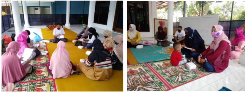
Gambar 2. Foto Kegiatan Pengabdian Kepada Masyarakat

Tujuan dari psikoedukasi kelompok adalah untuk mempertahankan homeostasis terhadap adanya perubahan yang tidak diperkirakan sebelumnya maupun kejadian yang terjadi secara bertahap. Psikoedukasi kelompok pada keluarga yang mempunyai anak usia pra sekolah (3-6 tahun) dilakukan untuk membantu keluarga mengatasi permasalahan yang dialami terkait pertumbuhan dan perkembangan, sharing pengalaman dalam memberikan stimulasi perkembangan anak serta belajar bagaimana memberikan stimulasi sesuai perkembangan anak untuk membantu anak mengembangkan inisiatif.