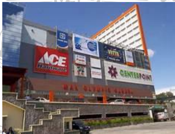
Gambar 3. 2 Dokumentasi MOG

Mall Olympic Garden (MOG) terletak di Jalan Kawi, Kauman, Kec. Klojen, Kota Malang.