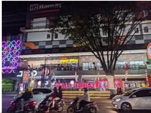
Gambar 3. 5 Dokumentasi Mall Dinoyo City

Mall Dinoyo City terletak di Jalan MT. Haryono No.195-197, Dinoyo, Kec Lowokwaru, Kota Malang.