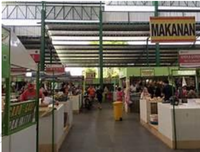
Gambar 3. 7 Dokumentasi Pasar Oro Oro Dowo

Pasar Oro-Oro Dowo terletak di Jalan Guntur No.20, Oro-Oro Dowo, Kecamatan Klojen, Kota Malang Jawa Timur.