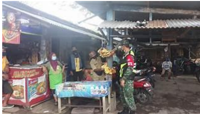
Gambar 3. 9 Dokumentasi Pasar Tawangmangu

Pasar Tawangmangu terletak di Jalan Tawangmangu No.8, Lowokwaru, Kec. Lowokwaru, Kota Malang