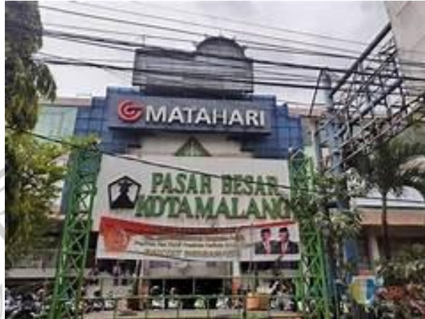
Gambar 3. 6 Dokumentasi Pasar Besar

Pasar Besar Malang terletak di Jalan Pasar Besar, Sukoharjo, Kecamatan Klojen, Kota Malang Jawa Timur.