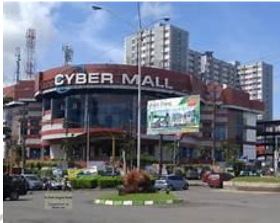
Gambar 3. 4 Dokumentasi Cyber Mall

Cyber Mall terletak di Jalan Raya Langsep No 2, Pisang Candi, Kec Sukun, Kota Malang.