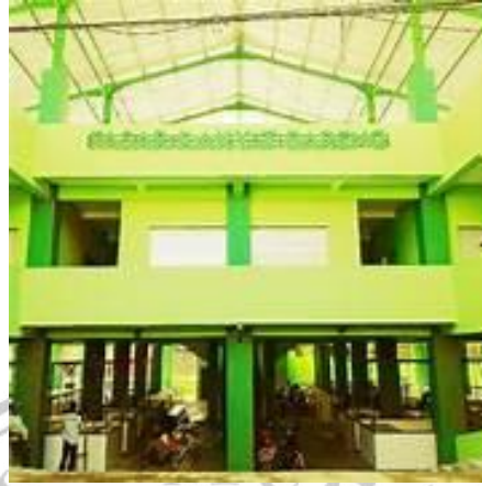
Gambar 3. 8 Dokumentasi Pasar Bareng

Pasar Rakyat Bareng terletak di Jalan Terusan Ijen, Bareng, Kecamatan Klojen, Kota Malang, Jawa Timur.