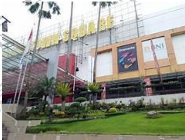
Gambar 3. 3 Dokumentasi MATOS

Malang Town Square berada di Jalan Veteran No. 2 Penanggungan Kec. Klojen , Kota Malang.