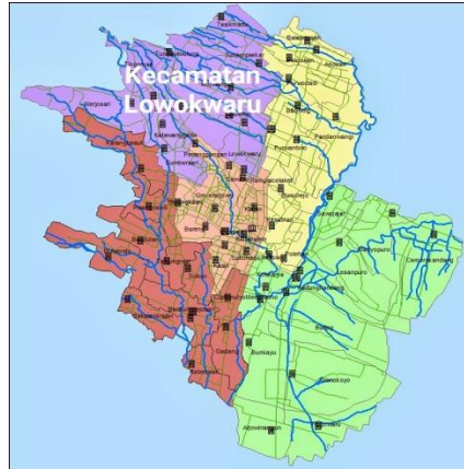
Gambar 3. 1 Peta Lowokwaru

Total jumlah penduduk se Kecamatan Lowokwaru Kota Malang adalah: 198.839 jiwa. (Sumber: data resmi BPS Kota Malang / 2021. Online https://www.jurnalmalang.com/2021/11/jumlah-penduduk-daftar-nama-kelurahan.html?m=1 .