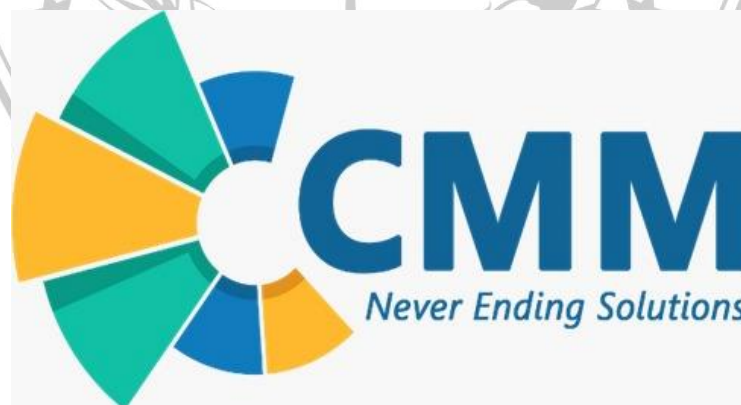
Gambar 1. Logo PT. Cakrawala Muda Mandiri

Filosofi logo PT. Cakrawala Muda Mandiri :