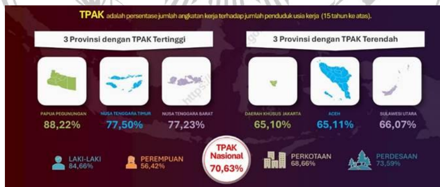
Gambar 1.1 (Badan Pusat Statistik, 2024)

Berdasarkan data dari Badan Pusat Statistik (BPS) terdapat 56,42% Perempuan yang termasuk dalam Tingkat Partisipasi Angkatan Kerja (TPAK) hingga Agustus 2024, dan persentase tersebut terus bertambah setiap tahunnya (Badan Pusat Statistik, 2024).