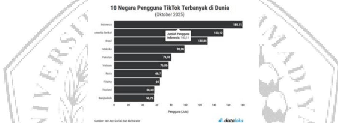
Gambar1. 2 Data pengguna Tiktok

jaringan profesional, memasarkan usaha, serta menyebarkan berita secara luas. Beberapa manfaat positif dari media sosial mencakup peningkatan dalam komunikasi dan akses yang lebih luas terhadap informasi. Dunia media sosial telah mengalami evolusi yang luar biasa, yang mencerminkan kemajuan teknologi dan dinamika sosial., dan telah bergabung penting dari aspek kehidupan kita, mengubah cara kita berinteraksi, berkomunikasi, dan berbagi data.