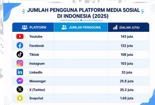
Gambar1. 1 Data jumlah pengguna platform media sosial

Berikut adalah daftar lengkap jumlah penggunanya.