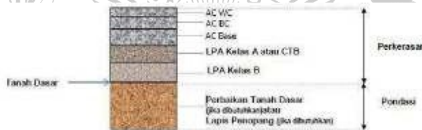
Gambar 2. 2 Struktur Perkerasan Lentur pada Tanah Dasar

Jenis struktur perkerasan yang diterapkan dalam desain struktur perkerasan baru terdiri atas: Struktur perkerasan pada permukaan tanah asli, susunan lapisannya dijelaskan pada Gambar 2.2 .