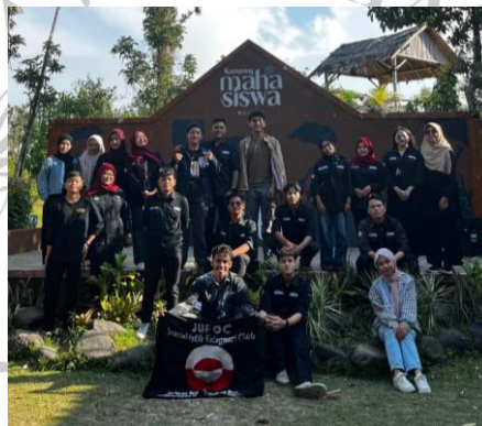
Gambar 2.3 Para Aktivis JUFOC

Sebagai organisasi yang telah berkembang, JUFOC memiliki sistematisasi organisasi yang dapat dikatakan sudah tersusun dengan rapi, seperti dasar, struktur, program kerja dan pengelolaan keuangan. Dengan keseluruhan tersebut, eksistensi JUFOC sebagai suatu organisasi dapat berjalan dengan lancar hingga sekarang. Anggota JUFOC merupakan mahasiswa dari Fakultas Ilmu Sosial dan Ilmu Politik (FISIP) Universitas Muhammadiyah Malang. Sistem rekrutmen anggota baru JUFOC dilakukan satu kali dalam satu periode kepengurusan.