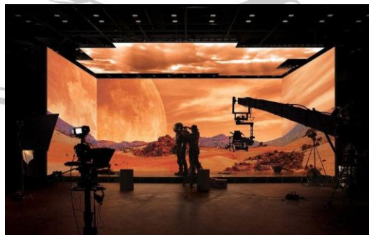
Gambar 2.2 Ilustrasi XR virtual screen

Dee Company , sebagai rumah produksi yang menaungi proyek “Siksa Neraka”, menunjukkan komitmen serius terhadap kualitas visual dengan mengalokasikan anggaran produksi sebesar kurang lebih Rp5 miliar. Investasi yang cukup besar ini difokuskan pada penguatan estetika film, yang meliputi pembangunan set produksi yang masif ( set building ), penggunaan teknologi XR Virtual Screen , hingga penerapan animasi CGI 3D yang kompleks. Besarnya pendanaan ini mencerminkan upaya maksimal rumah produksi dalam menghadirkan pengalaman sinematik yang tidak hanya bertumpu pada kekuatan narasi, tetapi juga pada kecanggihan teknis untuk menciptakan atmosfer neraka yang impresif dan meyakinkan bagi penonton..