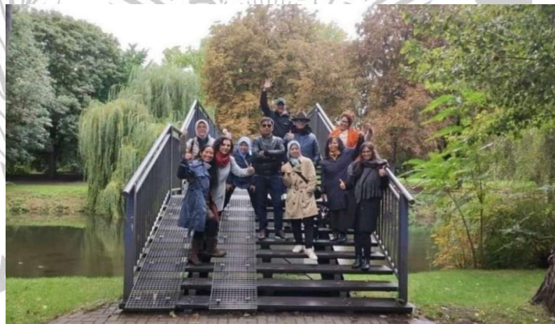
Gambar 2.8 Delegasi Kota Bandung Mengunjungi Jembatan Kota Bandung