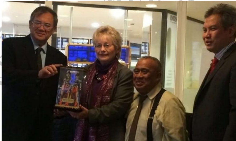
Gambar 2.3 Walikota Ihbe Menyambut Para Tamu

Sumber: Laporan tahunan sister city Kota Braunschweig Tahun 2017