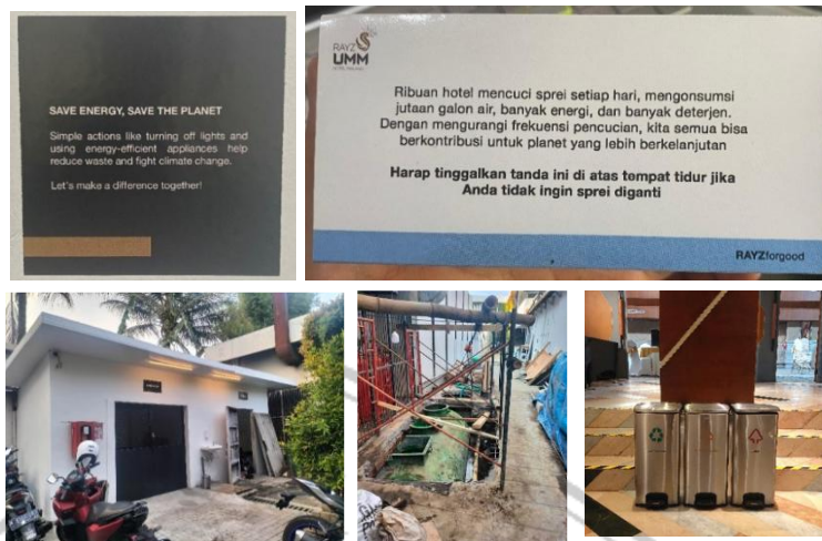
Gambar 1.2 Langkah Manajemen Rayz UMM Hotel yang mencerminkan Penerapan Green Talent Management dan praktik keberlanjutan