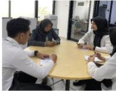
Gambar 1.4 Wawancara dengan HRD Coordinator