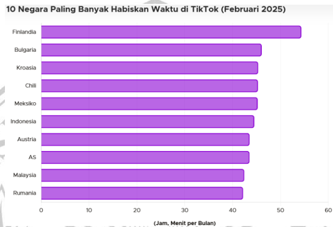
Gambar 1. 2 Data Negara dengan Waktu Penggunaan TikTok Paling Banyak Pada Februari 2025

Pada zaman digital, penggunaan perangkat elektronik, terutama media sosial, sudah menjadi bagian dari kehidupan sehari-hari. Media sosial dapat memudahkan orang untuk berbagi atau menerima informasi, berkomunikasi serta berinteraksi dengan individu lainnya, atau menyalurkan hiburan dalam waktu singkat. Meski begitu, penggunaan media sosial yang terlalu sering dan tidak digunakan secara bijak bisa membuat seseorang semakin tergantung pada media tersebut.