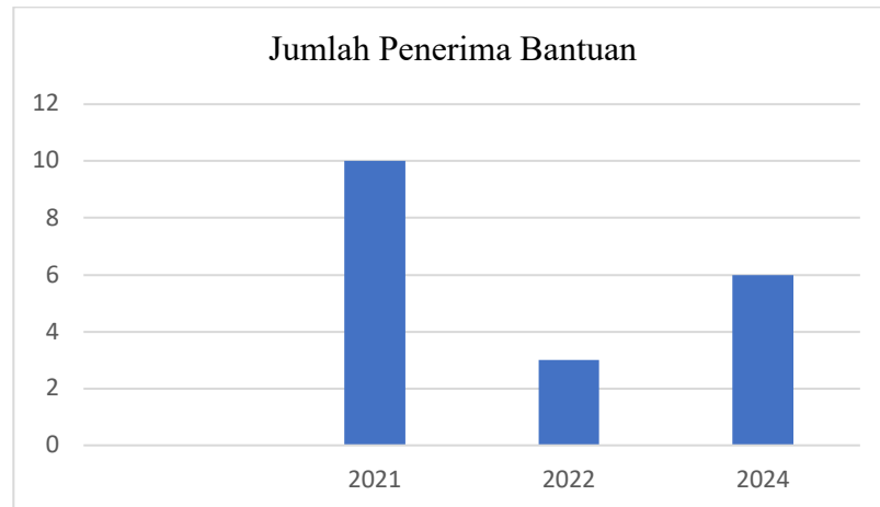
Tabel 1. 2 Jumlah Penerima Bantuan Transportasi Pendidikan