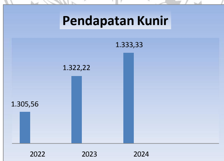
Gambar 1. 1 Grafik Kunir Desa Sombo Kecamatan Poncol Sumber: RPJMDES Desa Sombo Tahun 2020-2027