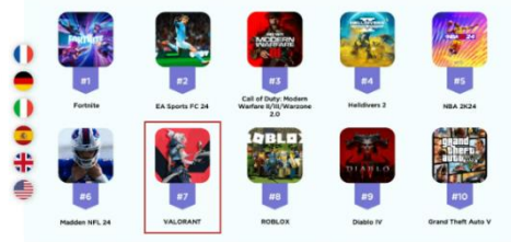
Gambar 1. 1 Top 10 Game PC dan Konsol 2024