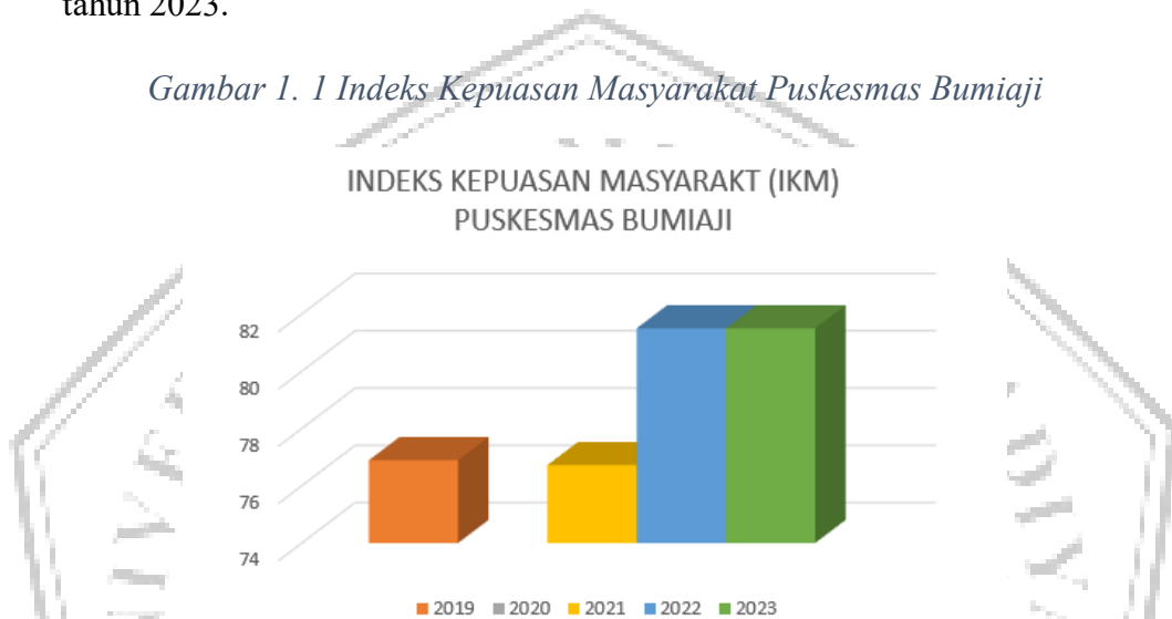
Gambar 1. 1 Indeks Kepuasan Masyarakat Puskesmas Bumiaji