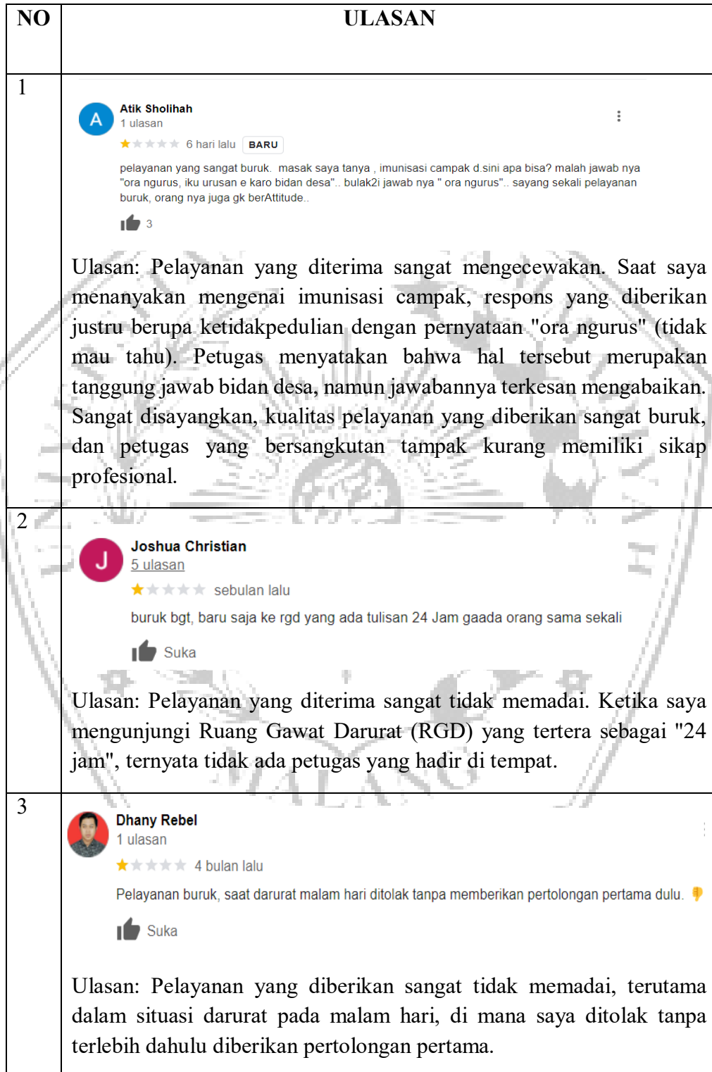
Tabel 1. 1 Ulasan Masyarakat di Google Review Puskesmas Bumiaji