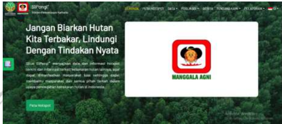
Gambar 2.1.4. 1 Website Layanan Sipongi+

Nasional Penanggulangan Bencana (BNPB), aparat desa, tokoh masyarakat, serta MPA, yang dilakukan terutama di desa-desa yang rawan terjadi karhutla. 167