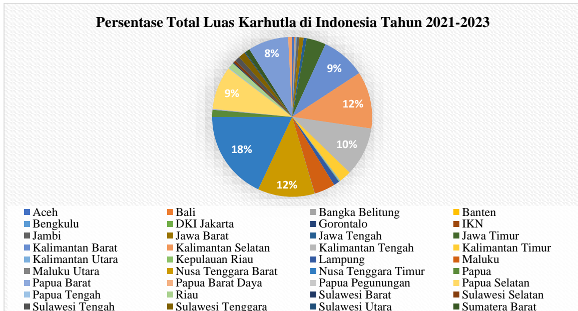
Grafik 2.1.3. 1 Persentase Total Luas Karhutla di Indonesia (2021-2023)

Sumber: https://sipongi.menlhk.go.id/indikasi-luas-kebakaran