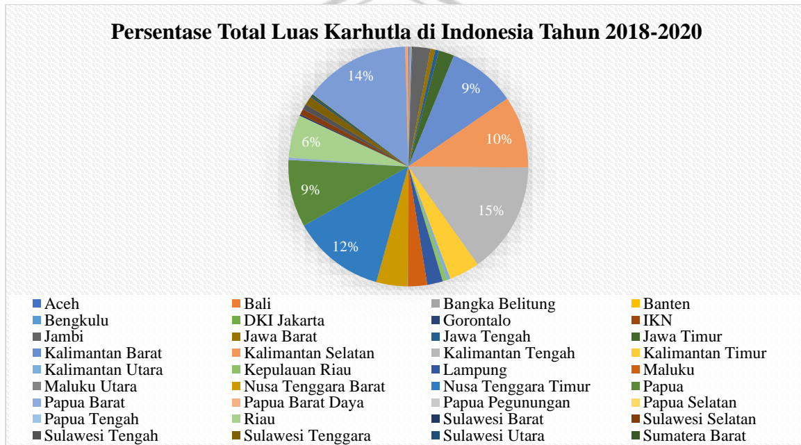
Grafik 2.1.2. 1 Persentase Total Luas Karhutla di Indonesia (2018-2020)

Sumber: https://sipongi.menlhk.go.id/indikasi-luas-kebakaran