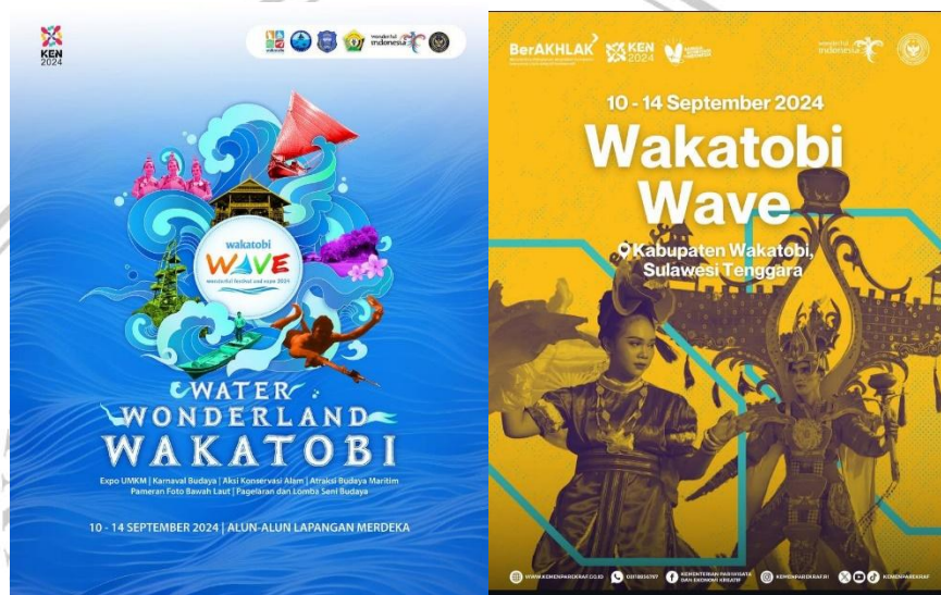
Gambar 2.1 poster penyelenggaraan Wakatobi Wave

Pemerintahan Daerah juga secara aktif mempromosikan Wakatobi Wave di berbagai sosial media seperti Instagram, Facebook dan juga Tiktok dengan poster poster yang menggambarkan penyelenggaraan Wakatobi Wave, seperti gambar dibawah: