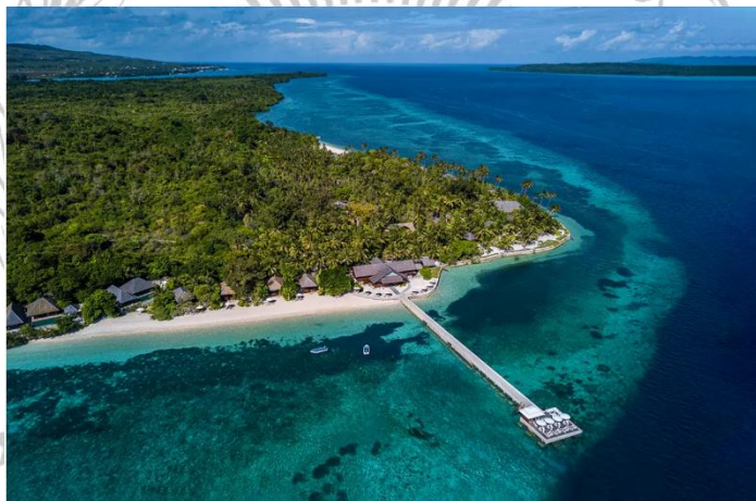
Gambar 2.2 Marind Dive Eco Resort

Investasi asing yang ada di Wakatobi umumnya terpusat pada sektor pariwisata dengan pembangunan hotel, resor dan juga fasilitas lainnya yang mendukung perkembangan ekonomi di Wakatobi dan menguntungkan bagi investor. Salah satu investasi asing langsung yang ada di Wakatobi ialah dengan adanya pembangunan Marind Dive Eco Resort di pulau Tomia. Diketahui salah satu investasi asing yang ada di Wakatobi adalah dengan adanya resort ini. Marind Dive Eco Resort menjadi salah satu tempat penanaman modal asing atau PMA milik Mr. Lorenz Maedaer yang merupakan orang berkebangsaan Swiss.