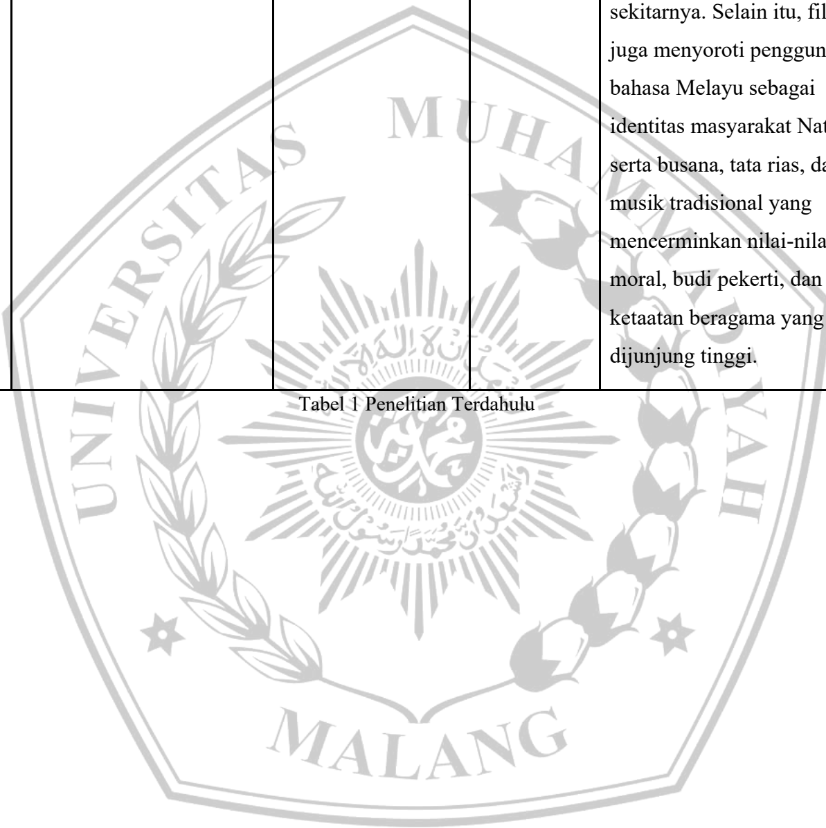
Tabel 1 Penelitian Terdahulu