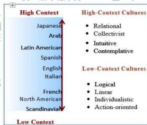
Gambar 2. 2 Ilustrasi Konteks Tinggi dan Rendah oleh Edward T. Hall

Menurut Edward T. Hall mengutamakan sebuah konteks dari budaya, konteks yang diartikan oleh Hall yaitu mengarah pada komunikasi Antarbudaya yang menyatakan bahwa komunikasi Antarbudaya ini dibagi menjadi dua, yaitu adanya komunikasi konteks tinggi dan komunikasi konteks rendah. Komunikasi konteks tinggi dipahami sebagai komunikasi yang melibatkan adanya hubungan interpersonal, lebih menekankan ke pesan-pesan nonverbal, dan pesan konteks tinggi lebih sedikit untuk menyampaikan informasi, komunikasi konteks tinggi lebih merujuk kepada kontemplatif dan intuitif. Sedangkan komunikasi konteks rendah mengarah pada analitis, logis, dan kebiasaan dalam bertindak. Konteks rendah menjadi pertukaran pemikiran atau ide yang memiliki fokus pada kata-kata dan simbol untuk menyampaikan informasi yang mereka sampaikan. (Saputri & Saraswati, 2017)