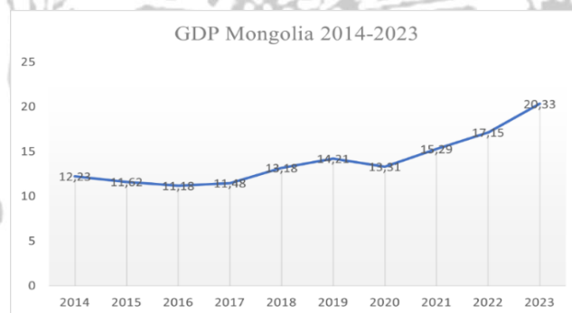
Grafik 2. 1 PDB Mongolia 2014-2023

Negara Mongolia merupakan salah satu negara berkembang di wilayah asia dengan memiliki tingkat pertumbuhan ekonomi yang lemah. Menurut data dari World Bank, negara Mongolia memiliki tingkat pertumbuhan ekonomi yang lambat sejak tahun 2014. 55 Adapun pertumbuhan ekonomi negara Mongolia yang dilihat dari besar PDB dalam kurun waktu 2014-2023 yang dapat dilihat dari grafik gambar dibawah ini