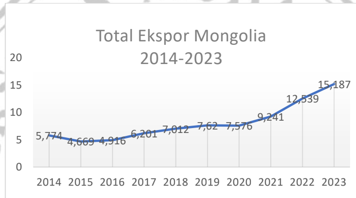
Grafik 2. 2 Total Ekspor Mongolia 2014-2023

dapat dilihat dari besar aktivitas ekspor dan impor Mongolia di setiap tahunnya. Dimana tahun 2023, ekspor Mongolia melonjak hingga mencapai 50% hal ini disebabkan oleh permintaan terhadap sektor tambang Mongolia yang meningkat. 62 Hal ini dapat dilihat melalui grafik berikut.