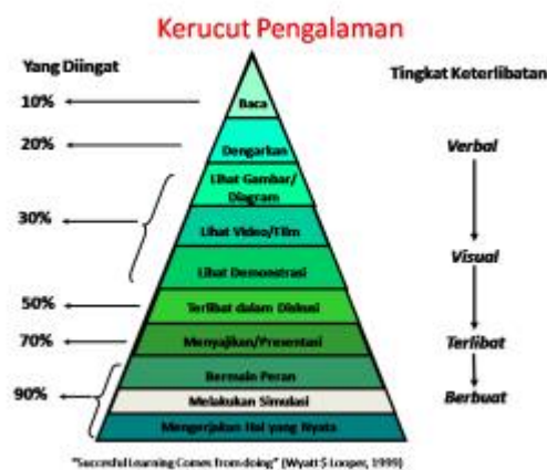
Gambar 2.1 Kerucut pengalaman Edgar Dale

Rusydah, Evi Fatimatur, dan Ali Mudhofir (2017) menawarkan klasifikasi penggunaan media berdasarkan tingkatan, mulai dari yang paling konkret hingga yang paling abstrak. Kategorisasi ini, yang kemudian disebut oleh Edgar Dale sebagai cone of experience , sering digunakan pada saat itu untuk memilih instrumen terbaik bagi proses pendidikan.