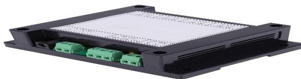
Gambar 2. 6 Isolated / RS485 Splitter Hub

Prinsip kerja dari RS485 Splitter Hub dimulai saat perangkat menerima data dari satu saluran input (RS485 atau RS232), kemudian mendistribusikan data tersebut secara paralel ke beberapa cabang output RS485. Data hanya mengalir satu arah dari input ke output sehingga tidak terjadi interferensi antar cabang. Setiap cabang dilengkapi isolasi untuk menjaga agar gangguan listrik atau kerusakan pada satu saluran tidak menyebar ke saluran lain. Dengan demikian, sistem komunikasi menjadi lebih stabil, andal, dan aman untuk digunakan dalam lingkungan industri yang menuntut keandalan tinggi.