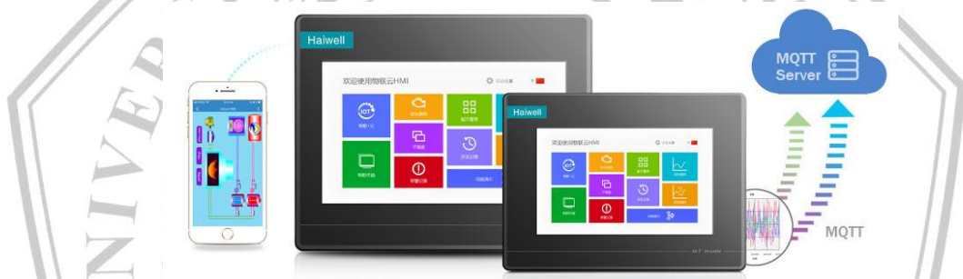
Gambar 2. 3 HMI Haiwell

Human Machine Interface (HMI) adalah sistem antarmuka yang menghubungkan manusia dengan mesin, memungkinkan operator untuk memantau dan mengendalikan proses industri melalui tampilan grafis yang interaktif. HMI berperan penting dalam meningkatkan efisiensi operasional, meminimalkan kesalahan manusia, dan mempercepat proses troubleshooting dalam berbagai sistem otomatisasi[4].