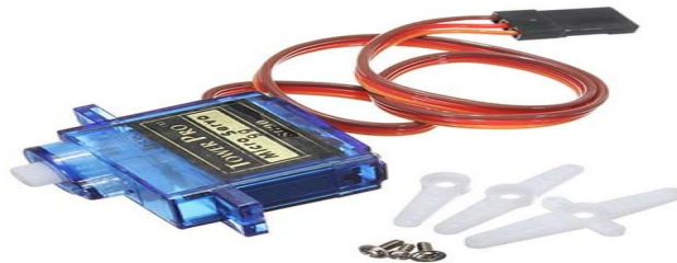
Gambar 2. 7 Motor Servo