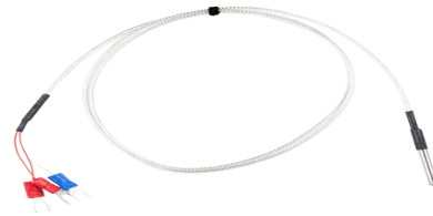
Gambar 2. 2 Sensor PT100