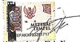
Noreen Abdurrahman Firly N