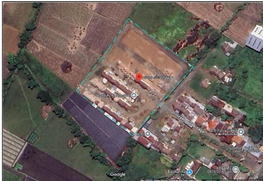
Gambar 2. 2 Lokasi Perencanaan Kawasan Perumahan

Gambar di atas merupakan gambar lokasi yang akan direncanakan sebagai kawasan perencanaan perumahan. Dalam perencanaan kawasan perumahan ini akan direncanakan 2 tipe rumah yaitu tipe 36\text{ m}^2 dan tipe rumah 45\text{ m}^2 . Luas lokasi \pm 14.562,34\text{ m}^2 , dalam lokasi ini juga akan direncanakan fasilitas umum pendukung yang sesuai dengan peraturan daerah mengenai pembangunan kawasan perumahan.