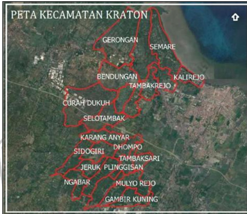
Gambar 2.1 Peta Kecamatan Kraton, Kabupaten Malang

Kecamatan Kraton berada dalam wilayah administratif Kabupaten Pasuruan. Kecamatan Kraton ini merupakan wilayah yang berfungsi sebagai penyangga perekonomian di bagian Utara Kabupaten Pasuruan. Kecamatan Kraton merupakan wilayah yang mencakup dataran rendah hingga dataran tinggi dengan altitude antara 0 – 1000 mdpl. Topografi wilayah ini cenderung sedikit miring ke arah timur dan utara dengan kemiringan lahan berkisar antara 0% hingga 30%. Suhu udara rata-rata berkisar antara 24°C - 32°C, sedangkan curah hujan tahunannya berada di bawah 1.750 mm. Dengan luas wilayah mencapai 90,89 km 2 , secara administratif Kecamatan Kraton terbagi menjadi 14 desa, 86 dusun, 151 Rukun Warga (RW), dan 530 Rukun Tetangga (RT). Wilayah paling utara di Kabupaten Pasuruan ini mencatat jumlah penduduk sebanyak 89.212 jiwa pada tahun 2023, dengan rincian 45.190 jiwa