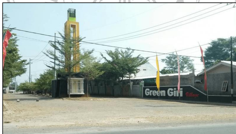
Gambar 2. 3 Representasi Visual Lokasi Perencanaan

Gambar di atas merupakan gambar lokasi yang akan direncanakan sebagai kawasan perencanaan perumahan. Dalam perencanaan kawasan perumahan ini akan direncanakan 2 tipe rumah yaitu tipe 36\text{ m}^2 dan tipe rumah 45\text{ m}^2 . Luas lokasi \pm 14.562,34\text{ m}^2 , dalam lokasi ini juga akan direncanakan fasilitas umum pendukung yang sesuai dengan peraturan daerah mengenai pembangunan kawasan perumahan.