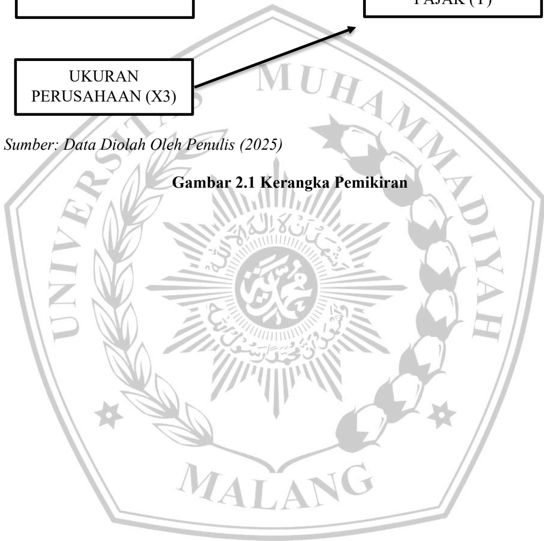
Gambar 2.1 Kerangka Pemikiran