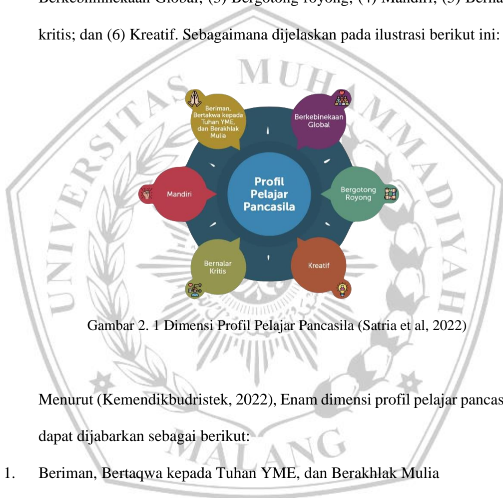
Gambar 2. 1 Dimensi Profil Pelajar Pancasila (Satria et al, 2022)

Profil Pelajar Pancasila menggambarkan pelajar Indonesia yang berkompetensi tinggi dan teguh, memiliki karakter positif dan nilai-nilai yang sesuai dengan prinsip-prinsip Pancasila, seperti: (1) Beriman, bertaqwa kepada Tuhan Yang Maha Esa dan berakhlak mulia; (2) Berkebhinnekaan Global; (3) Bergotong royong; (4) Mandiri; (5) Bernalar kritis; dan (6) Kreatif. Sebagaimana dijelaskan pada ilustrasi berikut ini: