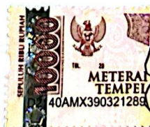
ENJELINA AULIA PUTRI