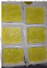
Proses pengeringan Fruit leather