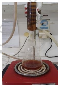
Pengujian kadar serat