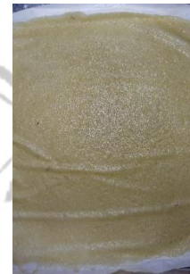
Fruit leather penambahan CMC 1,5%