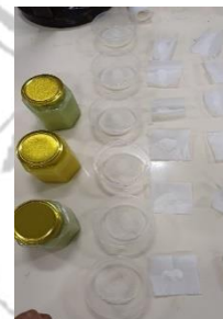
Persiapan bahan sesuai formulasi