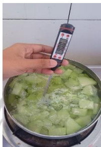
Blanching labu siam