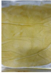
Fruit leather penambahan karagenaan 0,5%