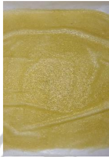
Fruit leather penambahan CMC 0,5%