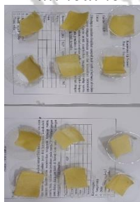
Pengujian analisa sensori