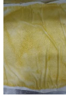
Fruit leather penambahan karagenan 1,5%