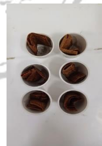
Pengujian kadar air