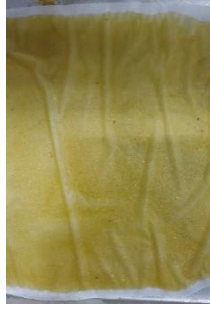
Fruit leather penambahan karagenan 1%