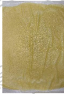
Fruit leather penambahan CMC 1%