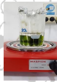
Pengujian kadar gula total