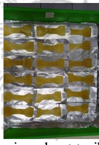
Pengujian kuat tarik dan elongasi