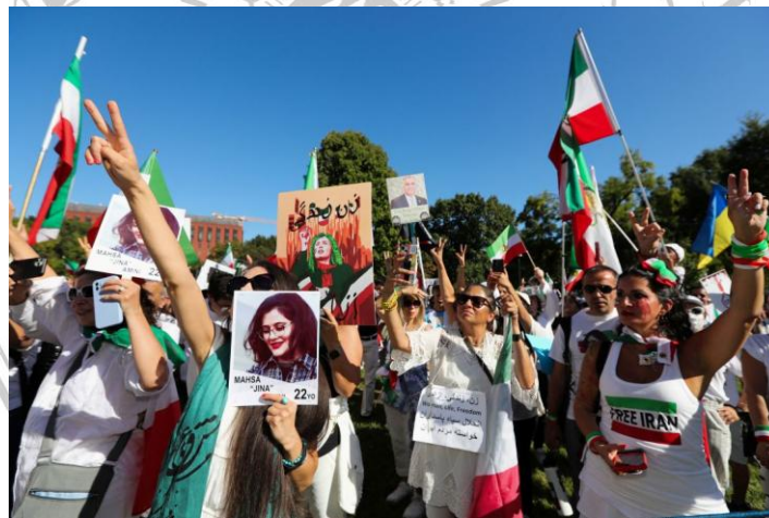
Gambar 2.1 Warga Iran berbaris di luar Gedung Putih untuk menyuarkan dukungan menuntut keadilan untuk Mahsa Amini

Unit ini sering melakukan patroli untuk memastikan perempuan mengenakan hijab dengan benar dan berpakaian sesuai dengan norma yang ditetapkan. Dalam praktiknya, mereka sering menggunakan cara-cara keras, termasuk pelecehan verbal dan fisik, untuk menegakkan aturan tersebut. 49 Kasus Mahsa Amini bukan satu-satunya insiden di mana aparat ini dituduh bertindak sewenang-wenang. Banyak laporan tentang perempuan yang mengalami perlakuan kasar, baik dalam bentuk teguran keras di depan umum maupun kekerasan fisik saat ditahan. 50 Namun, kematian Amini menjadi titik balik yang menyulut amarah masyarakat, yang merasa bahwa kekuasaan polisi moral telah melewati batas.