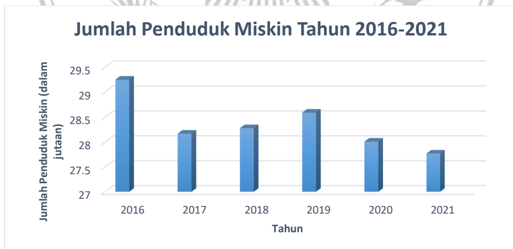
Gambar 1.1 Jumlah Penduduk Miskin di Indonesia Tahun 2016-2021