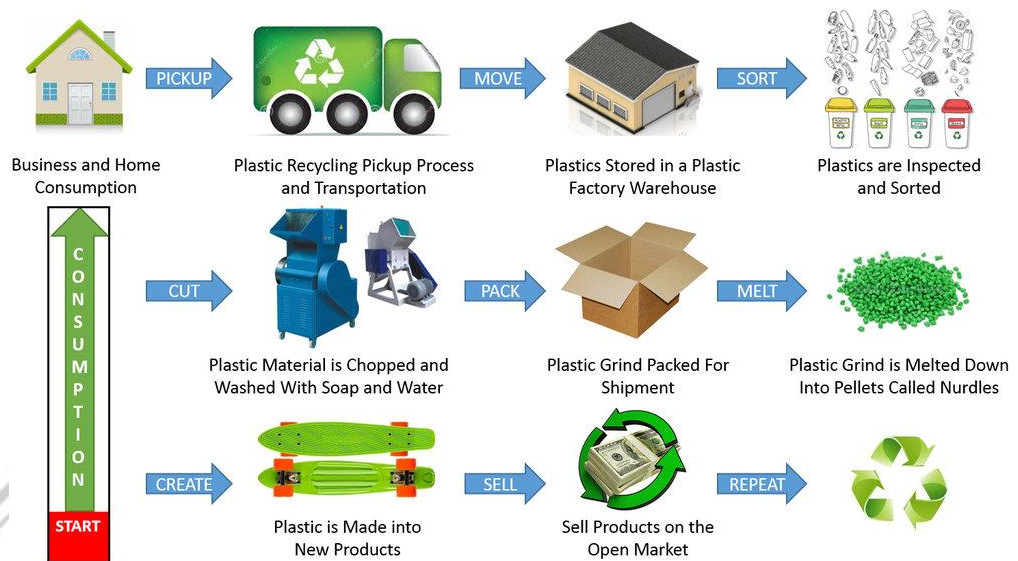
Gambar 2.3 Ilustrasi Konsep 3R