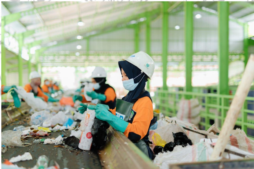
TPS Balak, Songgon.

Kemudian, TPS3R Sidodayu yang merupakan inisiasi dari Pemerintah Kabupaten Banyuwangi dengan PT. Systemiq Lestari Indonesia selaku pemberi