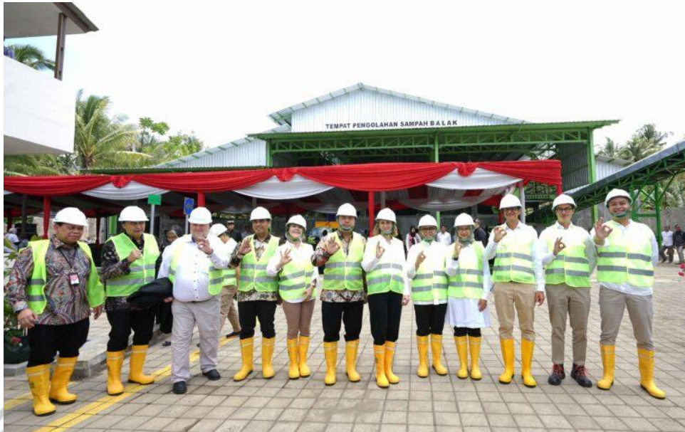
Gambar 2.5 Operasi TPS Balak