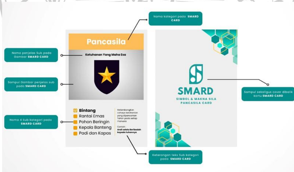
Gambar 3.3 Desain Media