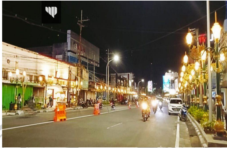
Gambar 4 6 Jalan Kayu Tangan