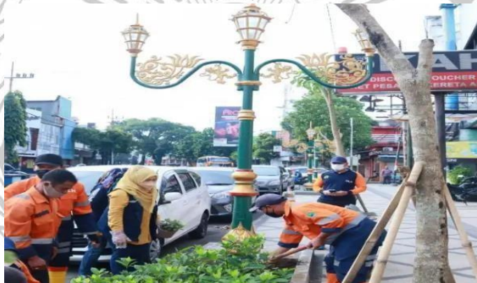
Gambar 4 4 Pembersihan Koridor Kayu Tangan Oleh DLH

Kayu tangan memiliki aspek tempat yang sangat strategis. Strategis yang dimaksud ialah kayu tangan dengan daya tarik wisata lain kota Malang sangat amat berdekatan. Sehingga wisatawan dapat mengunjungi dengan tidak satu tempat saja, daya tarik lainnya dapat dengan mudah di kenal. Infrastruktur yang di butuhkan oleh wisatawan juga lengkap, dengan letak yang berdekatan dengan penginapan, masjid, mall, dan rumah sakit menjadi salah satu kelengkapan dari infrastruktur itu sendiri. Kebersihan lingkungan juga menjadi aspek yang sangat penting, di sepanjang jalan kayu tangan telah di sediakan tempat sampah, juga kebersihan yang di perhatikan oleh pemerintah tentunya dengan kesadaran masyarakatnya sendiri.