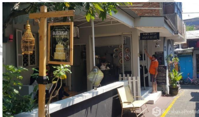
Gambar 4.5 Kampung Heritage Kayu Tangan

Dalam rangka pengelolaan kegiatan ekonomi, tinjauan dilakukan dengan memperhatikan sejumlah aspek seperti kemudahan dalam bekerja serta membuka lapangan pekerjaan baru, masyarakat akan mudah dalam mendapatkan hal tersebut. Masyarakat yang ada pada kawasan Kayu Tangan Heritage khususnya warganya, dapat menjual barang-barang yang berciri khas akan kota Malang, seperti makanan, aksesoris dan lain lain. Tidak hanya makanan dan aksesoris, Masyarakat juga dapat membangun cafe nuansa heritage sesuai dengan wisata jalan dan kampung tersebut. Masyarakat juga akan mendapatkan pemasukan melalui hasil fotografi dengan memberikan tawaran jasa kepada wisatawan untuk berfoto dengan background wisata Kayu Tangan tersebut.