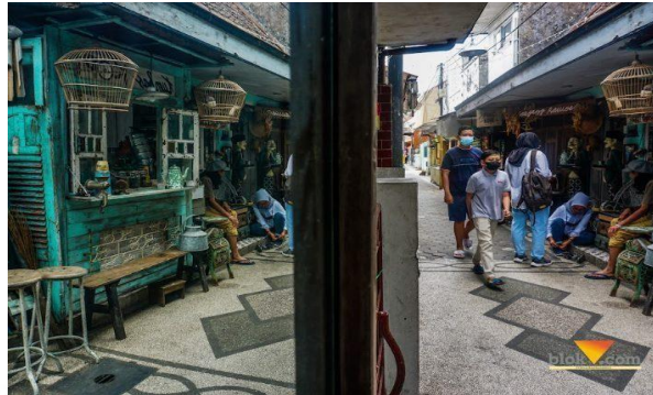
Gambar 4.7 masyarakat kampung dengan wisatawan