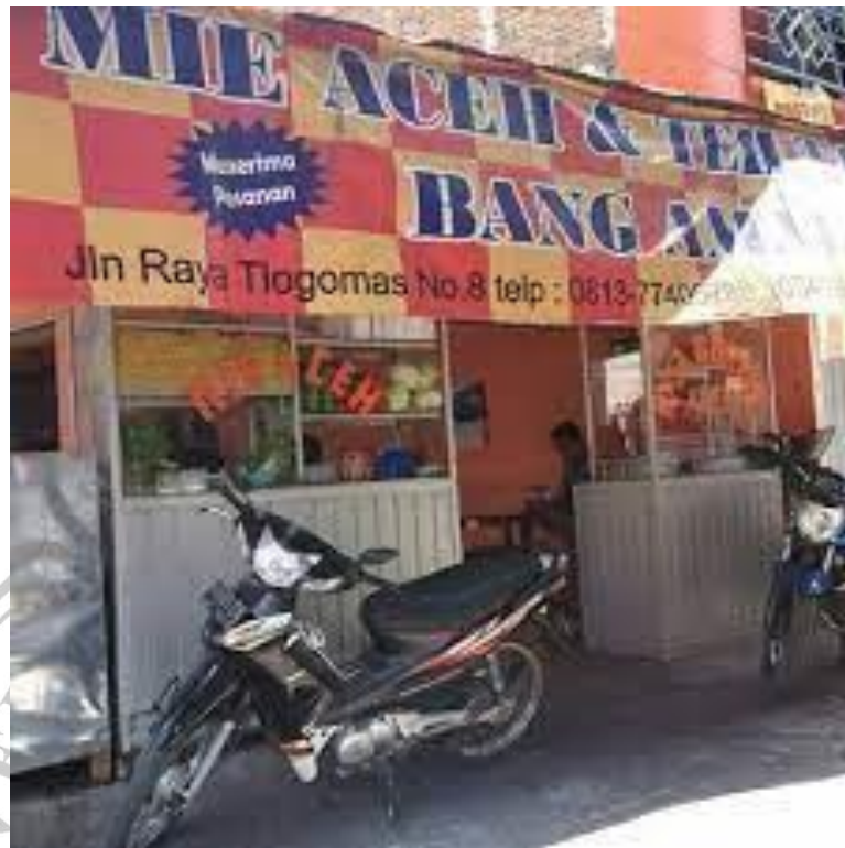
Gambar 4.2 Kedai Mie Aceh

Kota Malang merupakan kota yang cukup besar dalam menyajikan wisata kuliner, salah satunya Mie Aceh yang di operasikan oleh beberapa pelaku usaha seperti Mie Aceh Bang Ahmad, dengan ciri khas bumbu rempahnya yang kuat, menjadikan kuliner Aceh ini memiliki ciri khas. Memadukan konsep kuliner Aceh yang dipadukan dengan tempatnya yang minimalis ala foodcourt namun dalam satu naungan Mie Aceh Bang Ahmad, membuat kedai ini menjadi tempat yang nyaman untuk menikmati kuliner dan nongkrong. Mie Aceh Bang Ahmad ini berlokasi di Jln. Tlogomas No.8 Kota Malang. Dengan waktu operasional mulai pukul 11.00 sampai pukul 23.00.