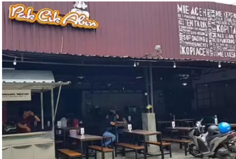
Gambar 4.3 Kedai Cak Abin

Kota Malang sendiri sebagai kota kuliner tentunya menawarkan banyak tempat kuliner enak, dari berbagai referensi dan ingin segera menikmati makanan karena rasa lapar setelah jalan-jalan di Kota Malang, maka Kedai Pak Cik Melayu Food ini menjadi pilihan untuk menikmati kuliner. Kedai Pak Cik Melayu Food ini berlokasi di Jln. Papa Hijau No 1A Kendalsari, Kota Malang. Dengan waktu operasional mulai pukul 11.00 sampai dengan pukul 23.30.