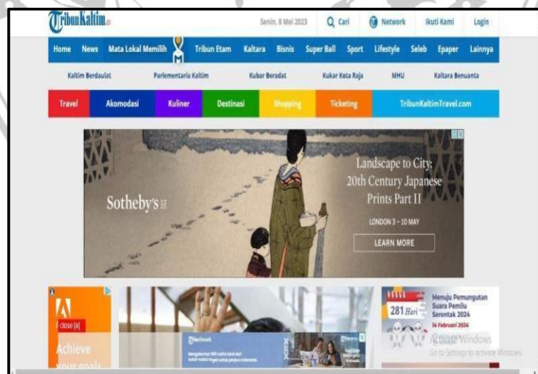
Gambar IV. 5 Web Koran Tribun Kaltim