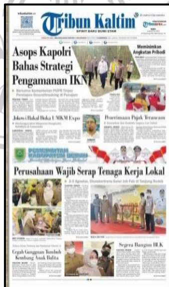
Gambar IV. 3 Bentuk Koran Tribun Kaltim