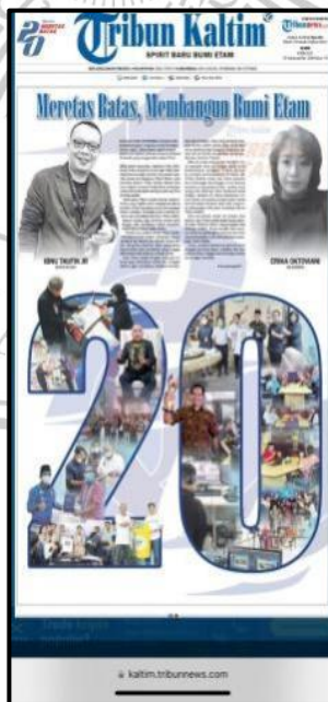
Gambar IV. 4 Bentuk Koran Elektronik Tribun Kaltim