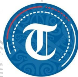
Gambar IV. 1 Logo Tribun Kaltim

Tribun Kaltim saat ini tengah berekspansi ke bidang media digital untuk mengikuti perkembangan teknologi dan terus melayani masyarakat dengan informasi. Hal ini dilakukan seiring dengan perkembangan zaman dan kemajuan teknologi. Tribun Kaltim mempublikasikan berita di situs web utamanya dan juga di situs media sosial lainnya seperti Youtube, Facebook, Instagram, Twitter, dan Tiktok. Tribun Kaltim juga menerbitkan koran elektronik yang disebut e-paper.