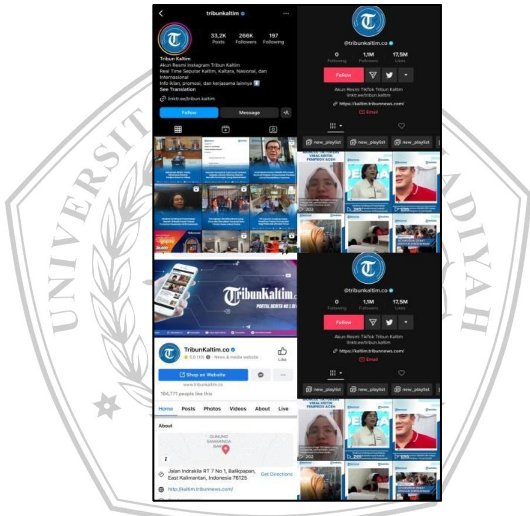
Gambar IV. 6 Media Sosial Tribun Kaltim

Di zaman modern ini, perkembangan masyarakat dan peningkatan teknologi terjadi pada tingkat yang semakin cepat. Berbagai teknologi dikembangkan untuk membantu mempermudah tugas-tugas rutin manusia.