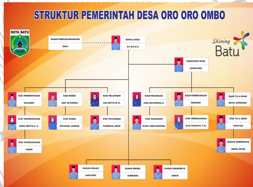
Gambar Struktur Pemerintah Desa Oro Oro Ombo