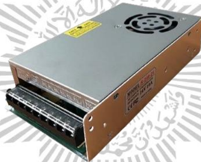
Gambar 2.6 Power Supply 24V/10A

Power supply atau yang biasa disebut catu daya merupakan sebuah komponen yang menyediakan daya listrik untuk perangkat listrik maupun elektronik. Pada dasarnya fungsi dari power supply sama dengan adaptor, hanya saja power supply umumnya lebih kompleks dan dapat digunakan untuk memberikan daya pada berbagai perangkat di dalam unit sistem. Meskipun terlihat sederhana namun komponen ini sangat penting sebagai pemberi daya pada alat atau mesin.