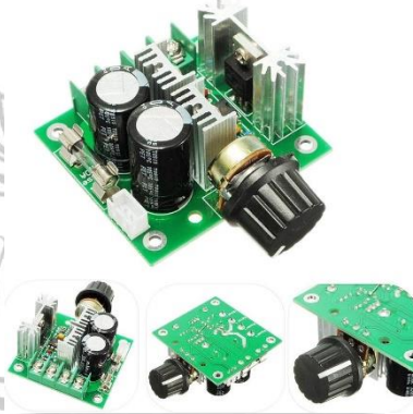
Gambar 2.8 PWM Module

PWM Module atau speed control merupakan salah satu komponen elektronika yang digunakan untuk mengontrol perputaran pada motor DC. Karena perputaran motor DC sangat bervariasi, maka dibutuhkan module speed control untuk mengatur kecepatan putaran sesuai dengan kebutuhan. Dalam alat ini, A348 pwm