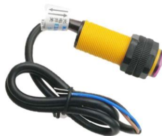
Gambar 2.3 Sensor Photoelectric E3F-DS30C4 NPN NO