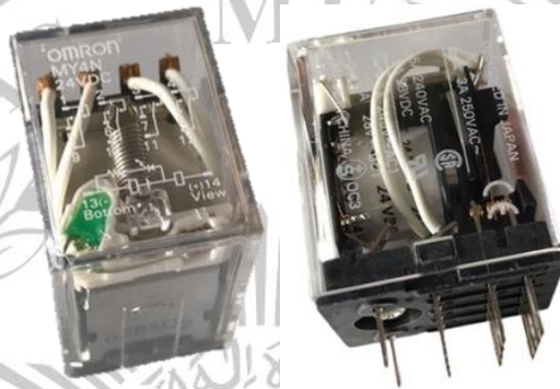
Gambar 2.4 Relay Omron MY4N

Relay merupakan suatu komponen elektronika berupa saklar yang digerakkan menggunakan tenaga listrik. Relay terdiri dari dua bagian yaitu komponen electromagnet (kumparan) dan komponen mekanis (saklar). Komponen ini menggunakan prinsip kerja elektromagnetik untuk menggerakkan saklar sehingga memungkinkan arus untuk mengalir. Relay memiliki banyak jenis dan fungsinya masing-masing. Dalam alat ini, relay akan digunakan sebagai perantara kontraktor PLC. Karena PLC memiliki batasan kapasitas yang dapat dilalui dan tidak bisa mengendalikan alat secara langsung maka dibutuhkan fungsi relay untuk perantaranya.