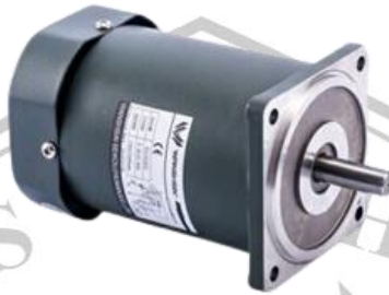
Gambar 2.2 Motor DC

Motor arus searah (motor DC) merupakan motor yang digunakan untuk mengubah energi listrik menjadi energi mekanik atau gerak. Prinsip kerja dari arus searah ialah dengan membalik fasa tegangan dari gelombang yang mempunyai nilai positif dengan menggunakan komutator, maka arus yang berbalik arah akan berputar dalam medan magnet [4]. Motor DC ini berfungsi sebagai penggerak pada perangkat elektronik dan listrik seperti konveyor, bor listrik dan sebagainya. Pada umumnya motor DC lebih sering digunakan daripada motor AC karena jenis motor ini mudah untuk dikendalikan. Dalam prinsip kerjanya motor ini menghasilkan putaran per menit atau disebut dengan RPM ( Revolution per Minute ) yang dapat berputar berlawanan dengan jarum jam ataupun searah dengan jarum jam.