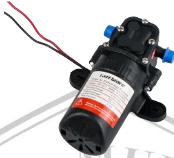
Gambar 2.7 Pompa Air DP-521

Pompa air merupakan alat yang mengkonversikan energi mekanik menjadi kinetik, dimana alat ini digunakan untuk memindahkan cairan atau fluida dari suatu tempat ke tempat yang lain. Dalam alat ini pompa akan bekerja dengan digerakkan oleh motor dimana pompa ini akan berfungsi untuk mengisi cairan didalam botol. Pada dasarnya pompa memiliki banyak jenis dan juga ukuran serta bahan pembuatan tergantung kebutuhan. Prinsip kerja dari pompa ini juga sederhana yaitu dengan mendorong air dari sumber yang telah ditentukan lalu air tersebut akan dipindahkan menggunakan impeller.