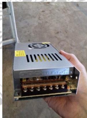
Gambar 2. 6 Power Supply 12 Volt

Mengonversi arus listrik yang berasal dari sumber daya menjadi tegangan dan arus yang tepat untuk digunakan oleh perangkat elektronik. Pada catu daya terdapat komponen yang melakukan tugasnya untuk menghasilkan tegangan yang sesuai. Salah satu contohnya adalah trafo, digunakan untuk menurunkan tegangan 220V AC menjadi 12V atau lebih rendah jika diperlukan. Power supply biasanya digunakan untuk menyediakan daya yang stabil dan teratur ke perangkat seperti komputer, ponsel, televisi, dan peralatan listrik lainnya.