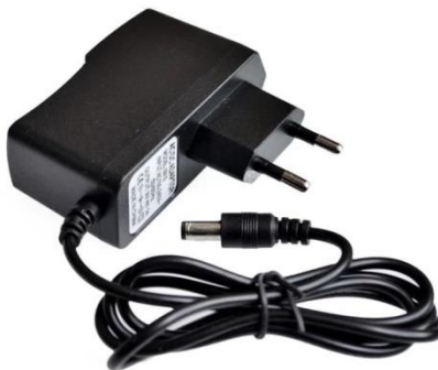
Gambar 2.8 Adaptor 12 volt

Adaptor memiliki fungsi utama untuk menyediakan sumber daya listrik yang stabil dan sesuai untuk papan Arduino dan komponen-komponen yang terhubung padanya.