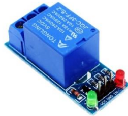
Gambar 2. 4 Relay 5 Volt