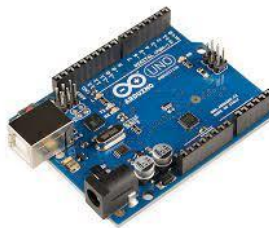
Gambar 2. 1 Arduino Uno

Arduino UNO merupakan perangkat yang dalam perancangannya membutuhkan software/perangkat lunak dan sering digunakan untuk membuat perangkat elektronik. Perangkat ini memiliki kegunaan, yaitu dalam menyempurnakan alat yang mampu berkerja dengan sendirinya. Mempunyai tiga komponen penting pada setiap board-nya: pin, konektor, dan mikrokontroler. Arduino memiliki beberapa kekurangan dan kelebihan. Kelebihannya adalah harga yang relatif terjangkau, untuk pemula sangat disarankan, dan memiliki pustaka yang dapat digunakan. Untuk kekurangannya seperti tidak dapat diinstal operating system (OS) sehingga tidak dioperasikan sebagai komputer pribadi, dan memuat ruang penyimpanan yang kecil.