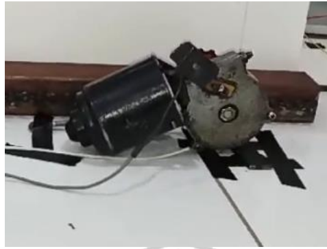
Gambar 2. 5 Motor DC 12 Volt