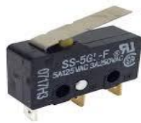
Gambar 2.7 Limit Switch 5 Volt