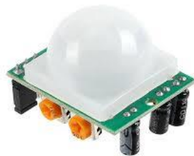
Gambar 2. 3 Sensor PIR HC SR501

Karakteristik utama dari sensor PIR HC SR501 adalah sensor ini hanya dapat mendeteksi radiasi infra merah yang berasal dari luar, bukan dari dalam. Karena setiap benda memancarkan energi dalam bentuk radiasi dan sensor ini dapat mendeteksi radiasi dari berbagai macam objek, misalnya manusia.