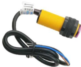
Gambar 2.3 Sensor Photoelectric