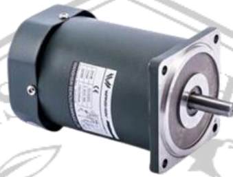
Gambar 2.2 Motor Dc

Motor arus searah (motor dc) merupakan motor yang digunakan untuk mengubah energi listrik menjadi energi mekanik atau gerak. Prinsip kerja dari arus searah ialah dengan membalik fasa tegangan dari gelombang yang mempunyai nilai positif dengan menggunakan komutator, maka arus yang berbalik arah akan berputar dalam medan magnet [4]. Motor dc ini berfungsi sebagai penggerak pada perangkat elektronik dan listrik seperti konveyor, bor listrik dan sebagainya. Pada umumnya motor dc lebih sering digunakan daripada motor ac karena jenis motor ini mudah untuk dikendalikan. Dalam prinsip kerjanya motor ini menghasilkan putaran per menit atau disebut dengan RPM ( Revolution per Minute ) yang dapat berputar berlawanan dengan jarum jam ataupun searah dengan jarum jam.