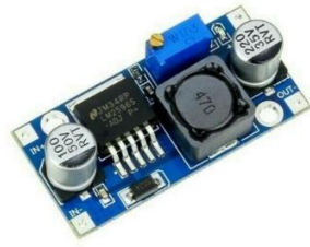
Gambar 2.5 LM2596

LM2596 merupakan salah satu komponen elektronika yang berfungsi untuk menurunkan tegangan masukan DC menjadi tegangan DC. Rentang tegangan output yang dihasilkan dapat diatur mulai dari 1,23 volt hingga 37 volt. Dalam alat ini LM2596 digunakan untuk menurunkan tegangan dari power supply menuju pompa yang digunakan untuk mengisi air.