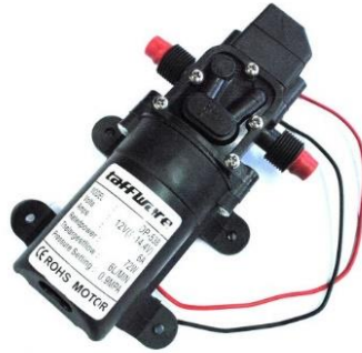
Gambar 2.7 Pompa Air

Pompa air merupakan alat yang mengkonversikan energi mekanik menjadi kinetik, dimana alat ini digunakan untuk memindahkan cairan atau fluida dari suatu tempat ke tempat yang lain. Dalam alat ini pompa akan bekerja dengan digerakkan oleh motor dimana pompa ini akan berfungsi untuk mengisi cairan didalam botol. Pada dasarnya pompa memiliki banyak jenis dan juga ukuran serta bahan pembuatan tergantung kebutuhan. Prinsip kerja dari pompa ini juga sederhana yaitu dengan mendorong air dari sumber yang telah ditentukan lalu air tersebut akan dipindahkan menggunakan impeller.