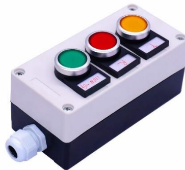
Gambar 2.8 Push Button

Pushbutton merupakan sebuah perangkat input yang digunakan dalam elektronika dan teknologi komputasi untuk menginisiasi atau memulai suatu proses atau aksi dengan menekan tombol. Tombol tersebut umumnya terdiri dari sebuah mekanisme yang ditekan secara fisik untuk menutup atau membuka sirkuit listrik.