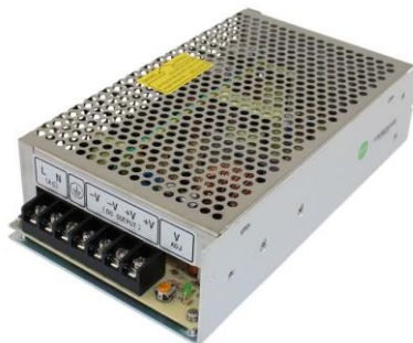
Gambar 2.6 Power Supply

Power supply atau yang biasa disebut catu daya merupakan sebuah komponen yang menyediakan daya listrik untuk perangkat listrik maupun elektronik. Pada dasarnya fungsi dari power supply sama dengan adaptor, hanya saja power supply umumnya lebih kompleks dan dapat digunakan untuk memberikan daya pada berbagai perangkat di dalam unit sistem. Meskipun terlihat sederhana namun komponen ini sangat penting sebagai pemberi daya pada alat atau mesin. Besaran tegangan arus listriknya juga bermacam-macam, biasanya berkisar antara 5-24 volt tergantung dengan kebutuhan.