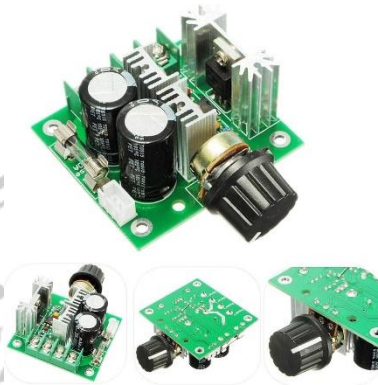
Gambar 2.9 PWM Module

PWM Module atau speed control merupakan salah satu komponen elektronika yang digunakan untuk mengontrol perputaran pada motor DC. Karena perputaran motor DC sangat bervariasi, maka dibutuhkan module speed control untuk mengatur kecepatan putaran sesuai dengan kebutuhan. Dalam alat ini, a348 pwm module digunakan untuk mengatur kecepatan motor pada konveyor, rotary capping dan juga pada motor untuk pemberian tutup botol agar bisa bergerak secara sinkron.