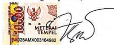
Mega Israhwati Putri