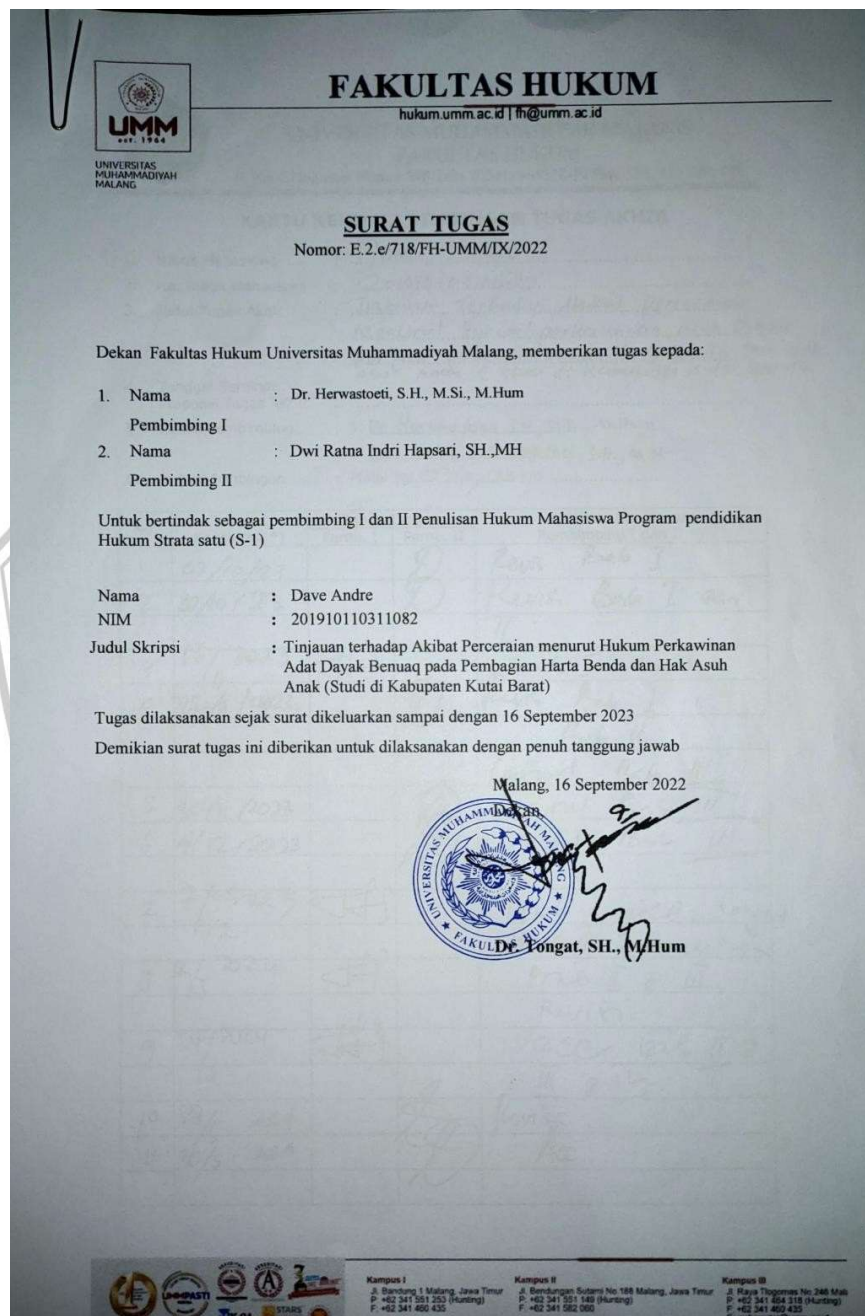
Lampiran 1 Lembar Tugas