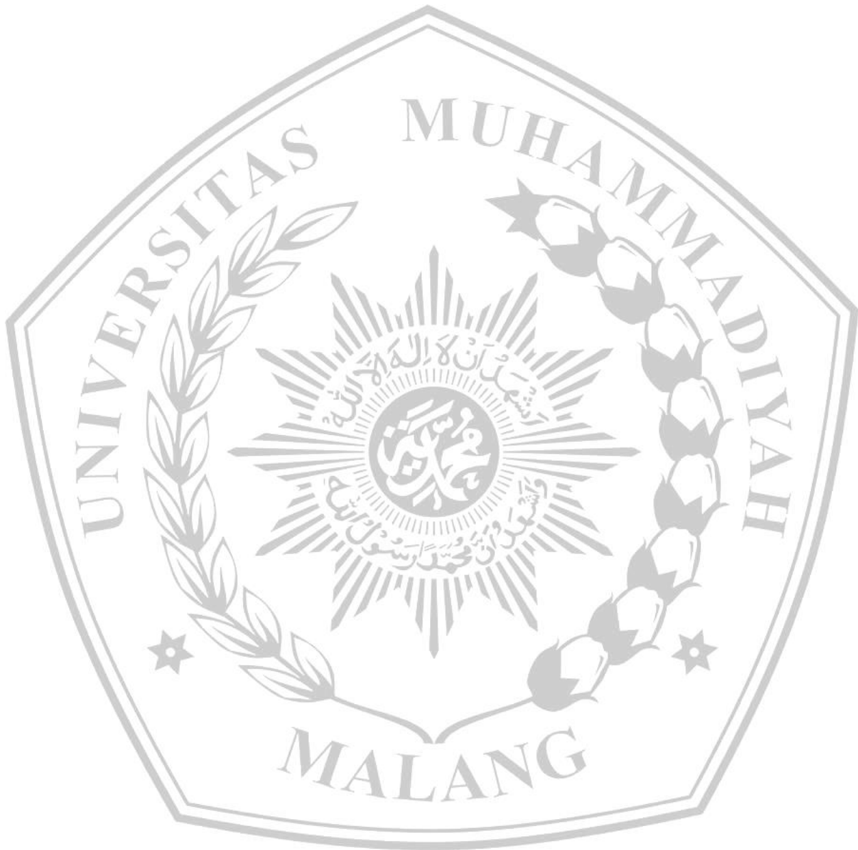
Tabel 2.9 Kumpulan kata netral